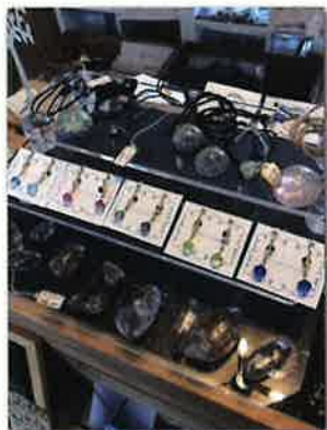
(オーナーが厳選した商品の数々)