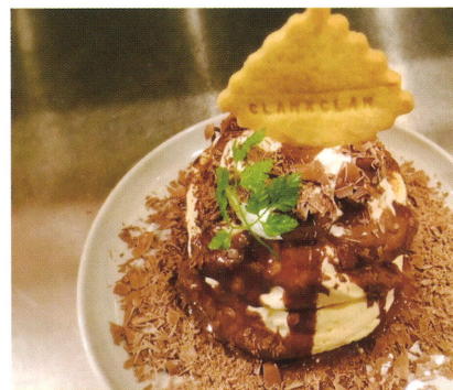
(自家製天然酵母を使用したパンケーキ)