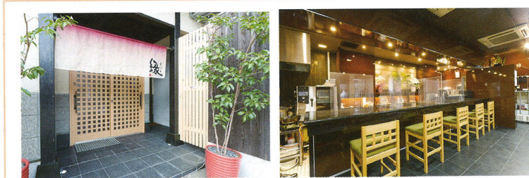
(店舗外観と和モダンな落ち着いた店内)

上分町に店舗を構える「ダイニング縁」。暖簾をくぐると和モダンな落ち着いた店内が迎えてくれます。外観から割烹料理店に見えますが、お客様のニーズに応え、和食だけでなく洋食も提供しています。目利きに優れたオーナーが選りすぐりの鮮魚や旬の野菜を仕入れ、素材を生かして調理された料理は、味はもちろん目でも楽しませてくれます。また、料理に欠かせない飲み物も種類が豊富で、特に日本酒は、市内ではあまり見ることのない地域の地酒を、期間限定で厳選して仕入れ提供しています。店内での食事はもちろん、テイクアウトや出張サービス