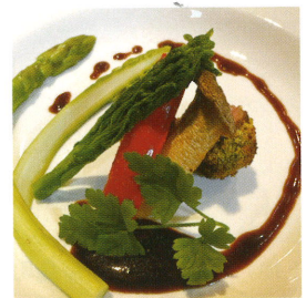
(厳選食材で調理した和食・洋食)