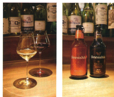
【日本産のワインと地ビール】

テーブルチャージ料は基本800円～。オーナー自らワイナリーに出向き厳選したワインは、1杯800円～1500円で提供しています。また、日本ワインは繊細な香りが特徴的で、香りをじっくりと楽しんで頂けるよう店内は禁煙