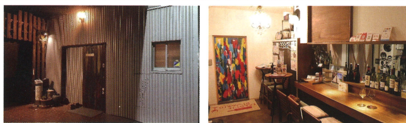
【店舗外観と店内の様子】

になっています。最近はお客様のニーズに応え、国産だけでなく海外産のワインも増やし、約200種類程の銘柄を取り揃えています。気軽に楽しめるワインバーなのでオーナーに好みを伝え、お薦めのワインを堪能してみてくださいはいかがでしょうか。