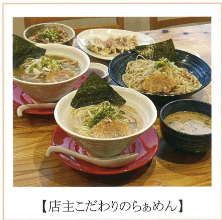
【店主こだわりのらめん】

東麺照一寛は、JR川之江駅から徒歩3分程と利便性も良く、カウンター席とテーブル席に加え、座敷席も備え、おひとり様から家族連れまで、ゆったりと食事を楽しむことができます。店長が厳選した食材は、地産地消を心がけ、“媛いりこらめん”のスープには地元で獲れる“媛いりこ”をふんだんに使用しています。また、麺やチャーシュー、餃子の皮に至るまで多くの商品が自家製で、化学調味料は使用せず、麺は健康に良いとされる全粒粉入りの自家製麺を使用した、大変体に優しいラーメンです。市内では珍しい“媛いりこらめん”を堪能されてみてはいかがでしょうか。