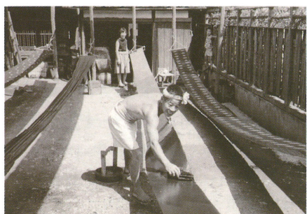
【着物の洗張風景(昭和35年頃)】