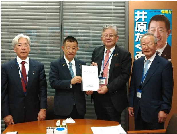
(井原衆議院議員に要望)