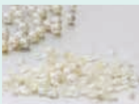
パールチップ (南土居真珠)