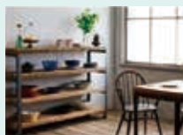
瀬戸内造船家具 (瀬戸内造船家具プロジェクト)