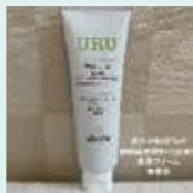
URUシリーズ (NM FIRM)