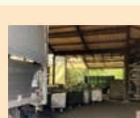
株式会社日本有機四国