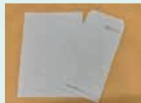
色綿紙 (愛媛県繊維染色工業組合)