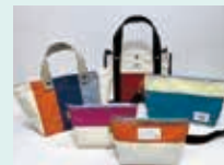
1010かばん (株式会社四国中央テント)