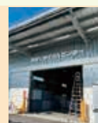
株式会社アイリック 空港リサイクルセンター