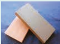
砥部陶板 (南伊予鋳業所)