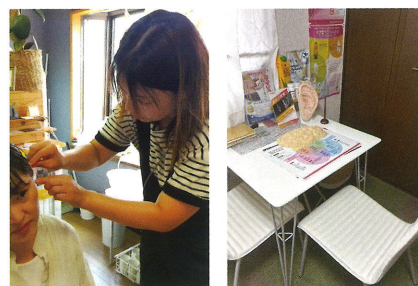
【施術の様子と店舗内観】

今後は、地域に密着した活動を通じて、生活習慣病の予防や健康意識の向上に貢献していく方針です。あわせて、耳つぼダイエットの資格取得を目指す人を支援し、指導者として地域で活躍する人材を増やしていくことも目標の一つとしています。「耳つぼダイエットは健康への投資。真に健康な人を増やしていきたい」との思いから、地域の健康づくりに取り組んでいきます。