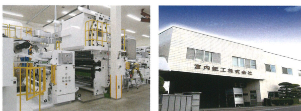
【押出ラミネート機械と本社外観】